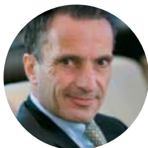
Henri Proglio, Président-Directeur Général

Les bons résultats témoignent de la pertinence de notre modèle économique, des effets des investissements réalisés ainsi que de la mobilisation de tous les collaborateurs du Groupe pour maîtriser les coûts et améliorer l'efficacité.